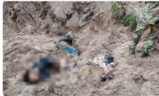
🇵🇱 Wydarzenia w INTERIA.PL - Interia Wojna w Ukrainie. Bucza: Ciała cywilów na ulicac...