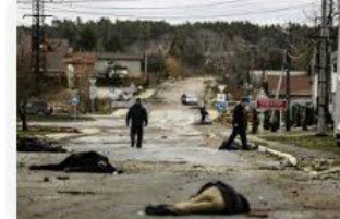
🇵🇱 Wyborcza.pl Wojna w Ukrainie. Piętrzą się dowody zbrodni woj...