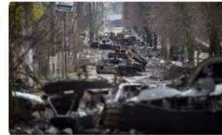
🇵🇱 Polsat News Wojna Rosja-Ukraina - Raport Dnia. Informacje o...