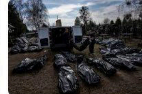
🇵🇱 Wyborcza.pl Wojna w Ukrainie. Dlaczego publikujemy zd...