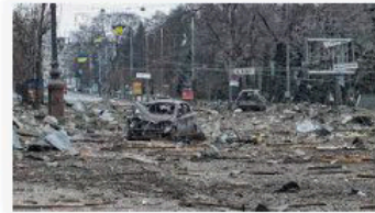
🇵🇱 Polsat News Wojna Rosja-Ukraina. Trybunał w Hadze wszczał śledz...