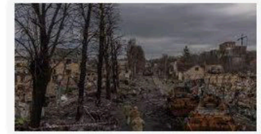
🇵🇱 RMF24 Zbrodnie wojenne w Ukrainie. Powstanie międzynarodo...