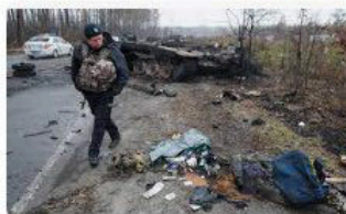
🇵🇱 Polskie Radio 24