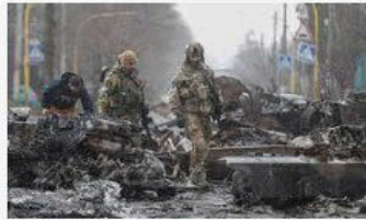
🇵🇱 Rzeczpospolita Ukraiński wywiad zamieszcza listę żołnierzy, którzy p...