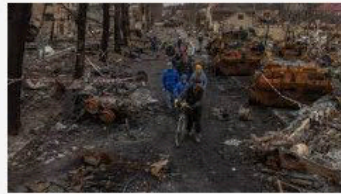
🇵🇱 Polsat News Wojna w Ukrainie. Prokurator generalna: zidentyfikowa...