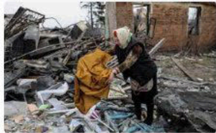
🇵🇱 TVP Info Wojna Rosji z Ukrainą. Prokuratura generalna p...