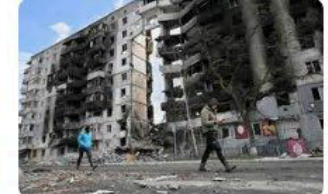
🇵🇱 Rzeczpospolita Wojna Rosji z Ukrainą. Rosjanie popełniali zbr...