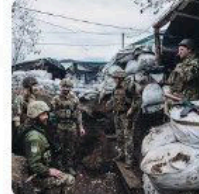
🇵🇱 TVN24 Wojna Rosja - Ukraina 2022 ...